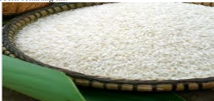
Gambar 4. Beras Ketan

Bahan baku lainnya berupa Beras Ketan digarang di atas wajan sampai menjadi arang. Arang Beras Ketan tersebut kemudian disiram air panas lalu digodok sampai mendidih sehingga terbentuk santan arang yang berwarna hitam. Kepekatannya akan bertambah setelah bubur arang ketan tersebut dicampur dengan Jelaga yang sudah dihaluskan. Daya tahan mangsi tradisional ini terbilang spektakuler alias tahan lama bila dibandingkan dengan mangsi (tinta) modern sekarang ini.