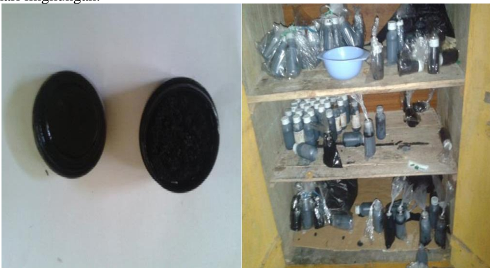
Gambar 2. Alat Tulis Ngalogat (Tinta Cina dan Tinta Gentur)

Selain Tinta Cina ada juga tinta yang suka digunakan para santri yaitu Tinta Gentur, sebagai salah satu bentuk kearifan lokal, Tinta Gentur merupakan salah satu yang unik, karena disamping memanfaatkan keanekaragaman hayati setempat, tinta ini pun dibuat dengan teknologi sederhana dan tidak mengikutsertakan bahan-bahan kimia yang dapat mencemari lingkungan.