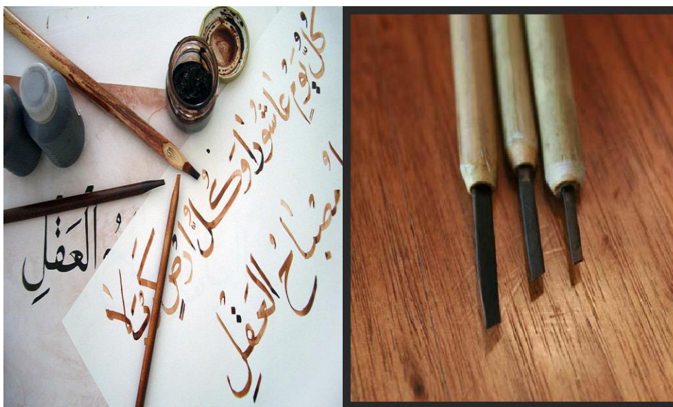
Gambar 1. Paku Handam Dan Harupat (Alat Tulis Ngalogat Tradisional)