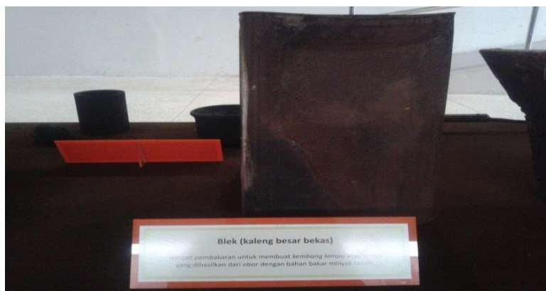
Gambar 3. Blek (Kaleng Besar Bekas)