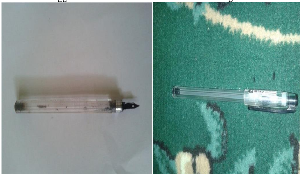
Gambar 6. Alat tulis Ngalogat (Kalam dan Merk Kenko)

Santri-santri yang kurang telaten dengan cara ini biasanya memilih menggunakan ballpoint merk Hi-tech dan Kenko yang menghasilkan tulisan tipis. Cara terakhir ini dianggap lebih praktis, karena untuk menggunakan pena diperlukan keahlian tersendiri. Setiap santri harus mengikuti pembacaan teks kitab kuning oleh sang ajengan , yang berhenti ketika mengambil nafas. Semakin terbiasa mengaji, semakin sedikit lafaz yang diberi arti oleh santri. Ia akan tinggal menuliskan arti dari lafaz baru dan asing.