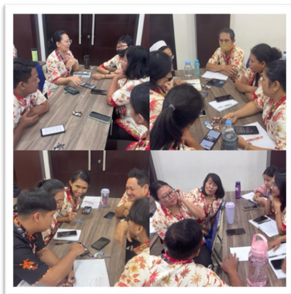
Gambar 2: Diskusi Kelompok Reflektif, Sarana Berbagi Pengalaman dan Pemaknaan Bersama

Partisipan penelitian terdiri atas 50 tenaga pendidik dari jenjang TK, SD, dan SMP yang mengikuti workshop dan mengisi instrumen evaluasi pasca kegiatan. Pemilihan partisipan dilakukan secara purposive karena seluruh peserta mengalami secara langsung proses pembelajaran dan refleksi selama workshop berlangsung. Karakteristik partisipan disajikan pada Tabel 1.