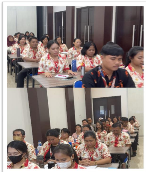
Gambar 1: Sesi Refleksi Individu, Sebagai Bagian dari Reflective Practice

Penelitian dilaksanakan pada kegiatan Workshop Reflektif bertema " Pelayanan yang Humanis dan Growth Mindset: Memimpin Diri, Melayani dengan Kesadaran " yang diselenggarakan pada 12 Februari 2026. Workshop berlangsung selama satu hari dan terdiri atas tiga sesi utama, yaitu (1) menyadari diri sebagai guru dan pelayan, (2) growth mindset: mengubah cara pandang dan hambatan diri, serta (3) pelayanan humanis dalam praktik dan komitmen bertumbuh. Kegiatan dirancang menggunakan pendekatan reflektif melalui pemaparan materi, refleksi individu, diskusi kelompok, dan berbagi pengalaman.