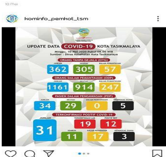
Gambar 1 Update Data Covid-19 di Kota Tasikmalaya 10 Mei 2020

Hasil penerapan dari PSBB ini, kota di Jawa Barat yang berhasil menurunkan jumlah pasien secara signifikan adalah kota Tasikmalaya. Setelah 5 hari (yaitu tanggal 6-10 Mei) hari berlalunya PSBB di Kota Tasikmalaya, jumlah kasus warga yang positif Covid-19 tidak mengalami penambahan. Hal tersebut terlihat dari data Dinas Komunikasi dan Informatika Kota Tasikmalaya dalam Instagramnya @kominfo_pemkot_tsm.