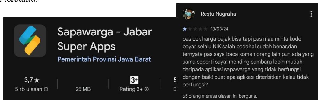
Gambar 2 Tangkapan Layar Rating dan Ulasan yang Diberikan oleh Pengguna Aplikasi Sapawarga di Playstore

Inovasi Pelayanan Aplikasi Sapawarga Dalam Mendukung Kebijakan Pembayaran Pajak Kendaraan Bermotor Pada Samsat Soreang Kabupaten Bandung apabila dianalisis dari karakteristik Relative Advantage (Keunggulan Relatif) dijelaskan bahwa inovasi pelayanan Aplikasi Sapawarga secara regulative ditujukan untuk memberikan kemudahan bagi masyarakat dalam membayar Pajak Kendaraan Bermotor dengan lebih efektif dan efisien waktu sehingga terhindar dari keterlambatan membayar pajak, dan dapat membantu meningkatkan kepatuhan wajib pajak. Pembayaran Pajak Kendaraan Bermotor dapat dilakukan dimana saja dan kapan saja, melalui inovasi Aplikasi Sapawarga ini juga Wajib Pajak dapat menghindari mengantre dan meluangkan waktu sibuknya untuk datang langsung ke Samsat Soreang untuk melakukan kewajibannya membayar Pajak Kendaraan Bermotor. Selain itu, melalui inovasi pelayanan Aplikasi Sapawarga target dan realisasi Pajak Kendaraan Bermotor dapat terbantu.