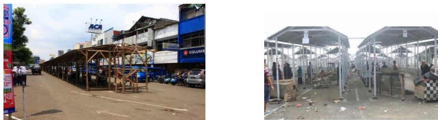
Gambar 3 Tempat Relokasi PKL

Gambar diatas merupakan proses pembangunan pasar pelita Kota Sukabumi. Dapat dilihat dari gambar diatas bahwa proses pembangunan mempunyai banyak lahan untuk dijadiam tempat berjualan. Maka dari itu perlunya beberapa tempat relokasi di beberapa lokasi pun dibutuhkan tempat yang sesuai dengan volume pedagang yang ada. Namun memang tidak semua pedagang enggan direlokasi bahkan banyak pedagang yang memilih di sekitaran Jalan Kapten Harun Kabir.