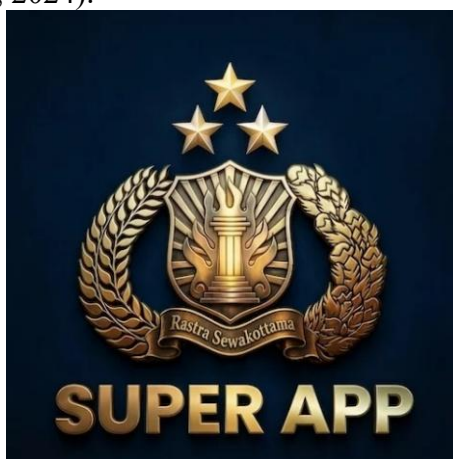
Gambar 2 Logo Aplikasi Polri Super App

Aplikasi Polri Super App merupakan inovasi digital yang diluncurkan oleh Kepolisian Republik Indonesia dengan tujuan utama untuk memudahkan akses masyarakat terhadap berbagai layanan kepolisian. Inovasi ini tidak hanya sebagai respons terhadap kebutuhan publik yang semakin meningkat, tetapi juga sebagai bagian dari strategi kepolisian untuk beradaptasi dengan perkembangan teknologi digital yang pesat. Dengan menghadirkan layanan dalam satu aplikasi yang terintegrasi, Polri berupaya meningkatkan efektivitas dan efisiensi dalam pelayanan publik (Ferrydjon, 2024).