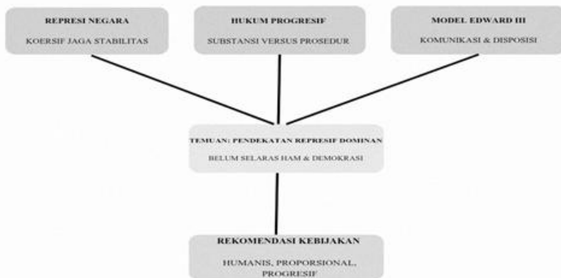
Gambar 2. Model Analisis Kebijakan Aparat Kepolisian dalam Penanganan Demonstrasi Penolakan UU Cipta Kerja Berdasarkan Teori Represi Negara, Hukum Progresif, dan Implementasi Kebijakan Edward III

Berdasarkan bagan pada Gambar 2, terlihat bahwa kebijakan aparat kepolisian dalam penanganan demonstrasi penolakan Undang-Undang Cipta Kerja berada pada titik pertemuan antara tuntutan menjaga stabilitas keamanan dan kewajiban negara untuk melindungi hak-hak konstitusional warga negara. Bagan tersebut menunjukkan bahwa respons negara terhadap protes sosial tidak dapat dipahami hanya melalui aspek keamanan semata, melainkan harus dianalisis melalui hubungan antara tindakan aparat, pelaksanaan regulasi, serta dampaknya terhadap kebebasan sipil masyarakat (Velarosdela, 2020).