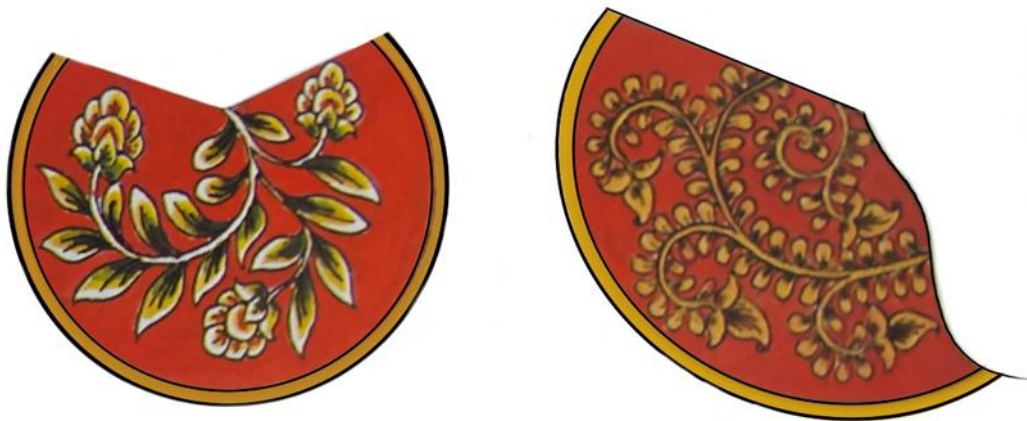
Gambar 5. Sungging Bludiran Gaya Yogyakarta

Ketiga, penggunaan unsur bludiran , yaitu teknik pewarnaan dengan efek tekstur atau timbul, sangat terbatas dalam wayang kulit Gagrak Yogyakarta. Aplikasi bludiran hanya ditemukan pada bagian-bagian tertentu yang memerlukan penekanan detail, seperti pada tali praba, yaitu ornamen yang melingkar di belakang kepala wayang (Sunarto, 1989). Pembatasan ini menjaga kesederhanaan dan keanggunan sunggingan secara keseluruhan.