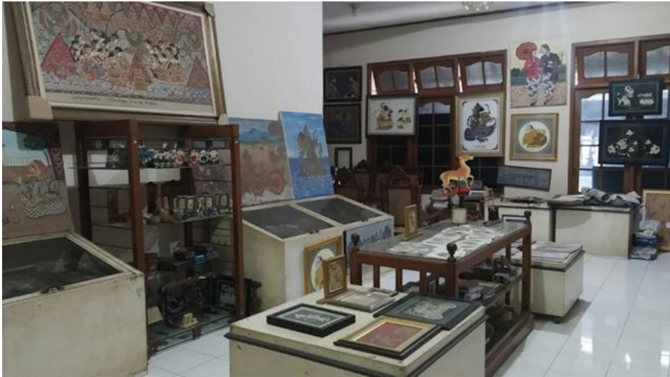
Gambar 1. Griya Ukir Kulit Sagio