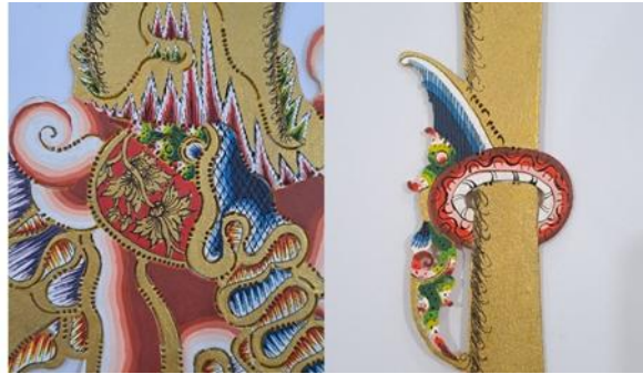
Gambar 22. Proses Nyawi