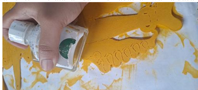
Gambar 14. Dikuwuk