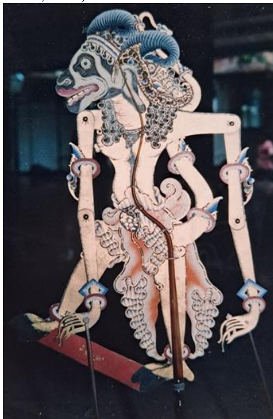
Gambar 2. Foto Hasil Sungging Kapi Menda dari Keraton Yogyakarta

Dalam pertunjukan wayang kulit Gagrak Yogyakarta, Wayang Kethek Rucah seringkali dihadirkan sebagai representasi dari tokoh-tokoh kera berwatak negatif atau berada di luar garis moralitas yang diidealkan. Karakteristik visualnya pun mendukung interpretasi ini; Wayang Kethek Rucah umumnya digambarkan dengan rupa yang kurang elok, mungkin dengan ekspresi wajah yang menyiratkan sifat nakal, serakah, atau bahkan brutal, kontras dengan penggambaran kera-kera lainnya seperti Anoman yang agung dan berwatak ksatria (Murtiyoso, 2017). Penokohan ini berfungsi sebagai antitesis terhadap karakter-karakter baik, memberikan dimensi kompleksitas pada narasi pewayangan dan seringkali digunakan untuk menyampaikan pesan moral tentang konsekuensi dari perilaku buruk. Kehadiran Wayang Kethek Rucah juga dapat menjadi elemen komedi dalam pertunjukan, meskipun esensinya tetap menyampaikan kritik sosial atau moral (Sulardi, 2010).