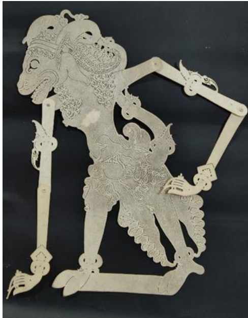
Gambar 10. Wayang Gebingan Kethek Rucak: Kapi Menda