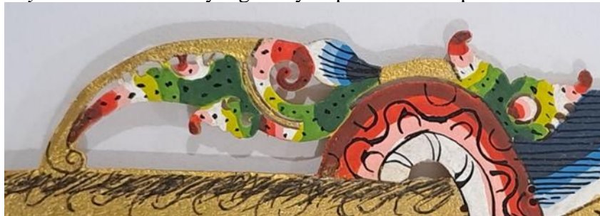
Gambar 23. Penerapan Drenjeman