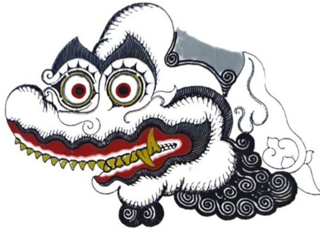
Gambar 6. Sungging Ulat-Ulatan Kera (Kapi) Gaya Yogyakarta