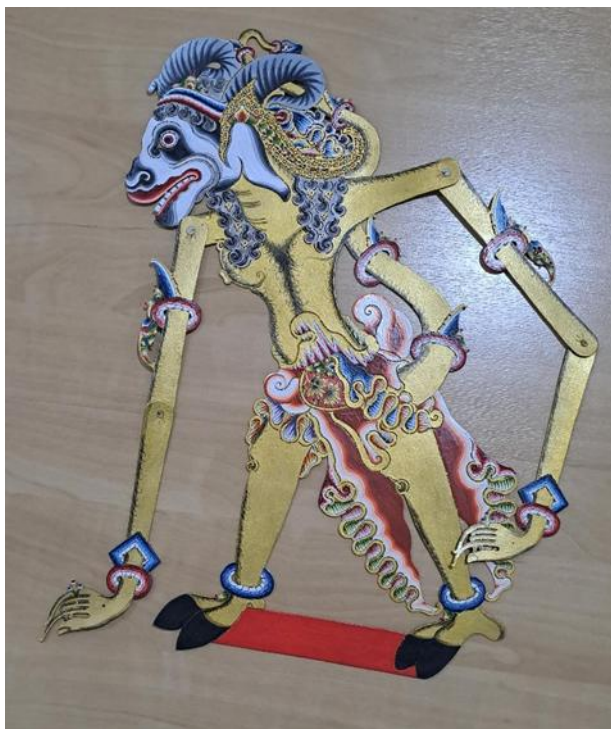
Gambar 25. Hasil Sungging Tradisional Wayang Kethek Rucah : Kapi Menda