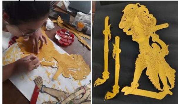
Gambar 13. Pemberian Warna Dasar