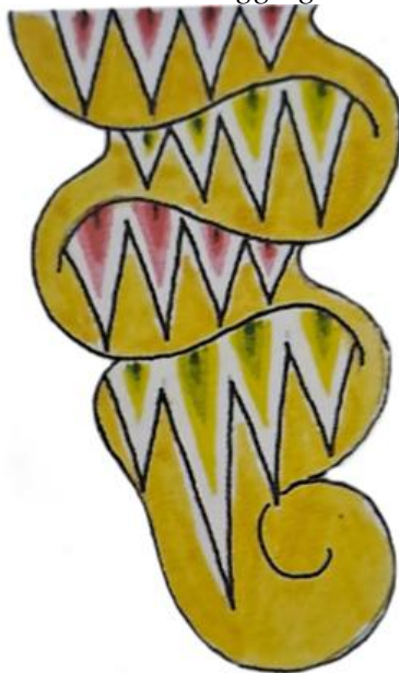
Gambar 3. Sungging Tlacapan Gaya Yogyakarta

Ciri khas sungging wayang kulit Gagrak Yogyakarta merupakan elemen fundamental yang membedakannya dari gaya pewayangan lain, sekaligus merefleksikan filosofi dan estetika budaya Jawa. Berdasarkan observasi dan kajian literatur, setidaknya terdapat enam karakteristik utama yang menandai kekhasan sunggingan ini (Sunarto, 1989).