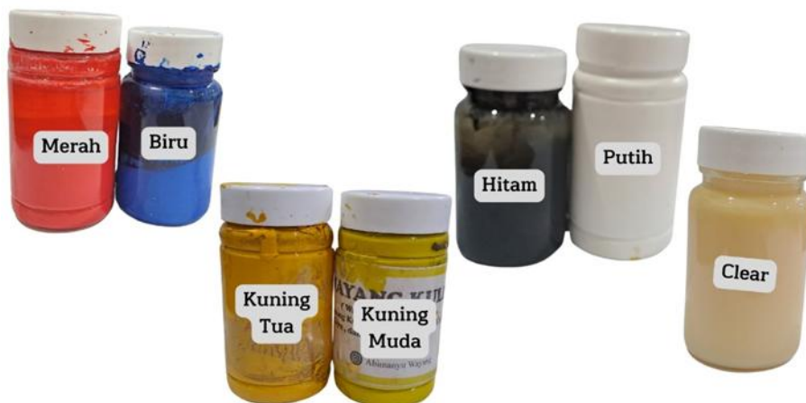
Gambar 11. Bahan-Bahan Sungging