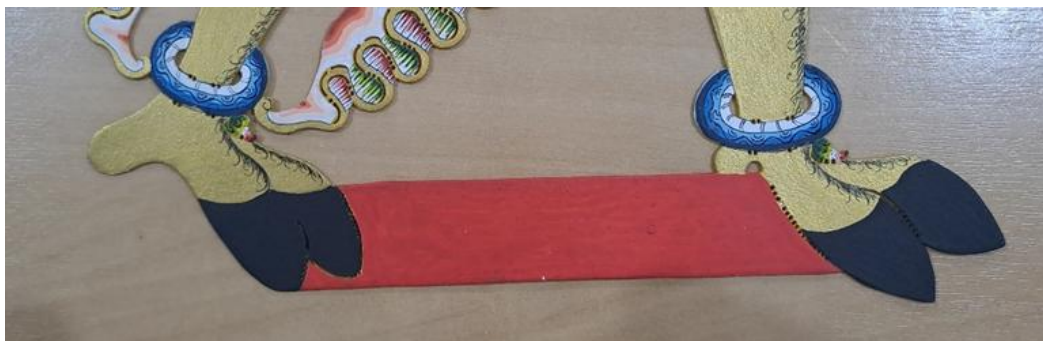
Gambar 8. Sungging Siten-Siten atau Lemahan Gaya Yogyakarta