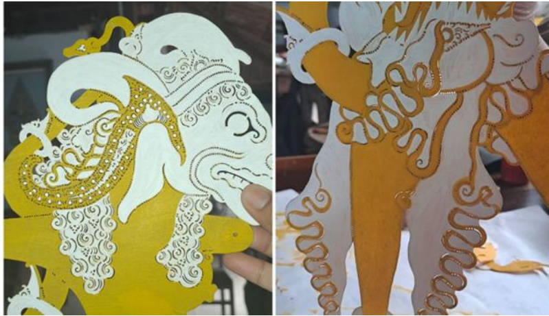
Gambar 15. Aplikasi Warna Putih