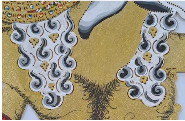
Gambar 19. Mewarnai Rambut