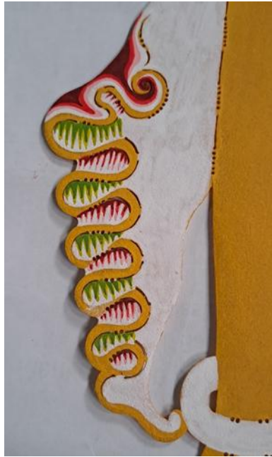
Gambar 17. Penerapan Teknik Sawutan