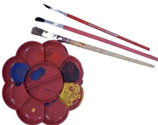
Gambar 9. Peralatan Sungging