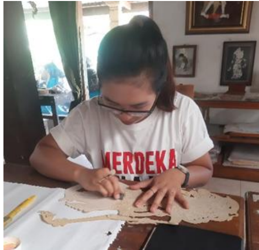
Gambar 12. Pengamplasan Wayang Gebingan