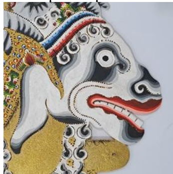
Gambar 24. Penerapan Muka