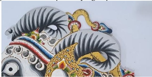
Gambar 20. Sungging Tanduk