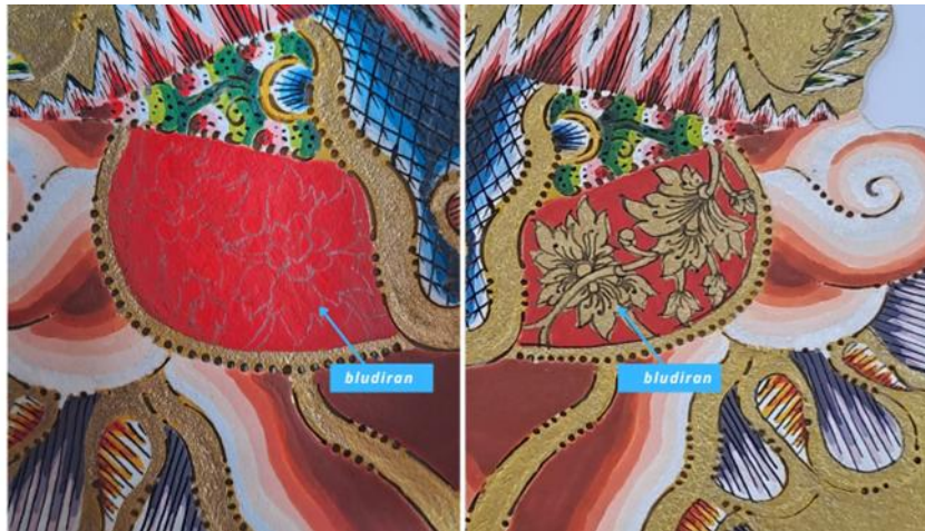
Gambar 21. Penerapan Bludiran