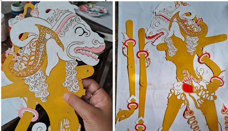
Gambar 16. Pewarnaan Merah Bergradasi