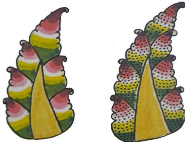
Gambar 7. Sungging Drenjeman, Gaya Yogyakarta

Kelima, sunggingan drenjeman , yaitu detail garis-garis tipis yang sering digunakan untuk mempertegas kontur atau tekstur, pada wayang kulit drenjeman , Gagrak Yogyakarta hanya menggunakan warna hitam saja (Sunarto, 1989). Penggunaan warna tunggal ini mendukung kesan yang rapi dan elegan, sesuai dengan karakteristik visual gagrak Yogyakarta.