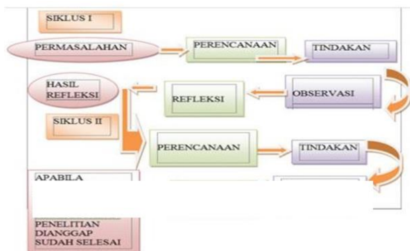
Gambar 1. Skema Penelitian Tindakan Sekolah

Secara skematis prosedur Penelitian Tindakan Sekolah (PTS) disajikan pada gambar berikut :