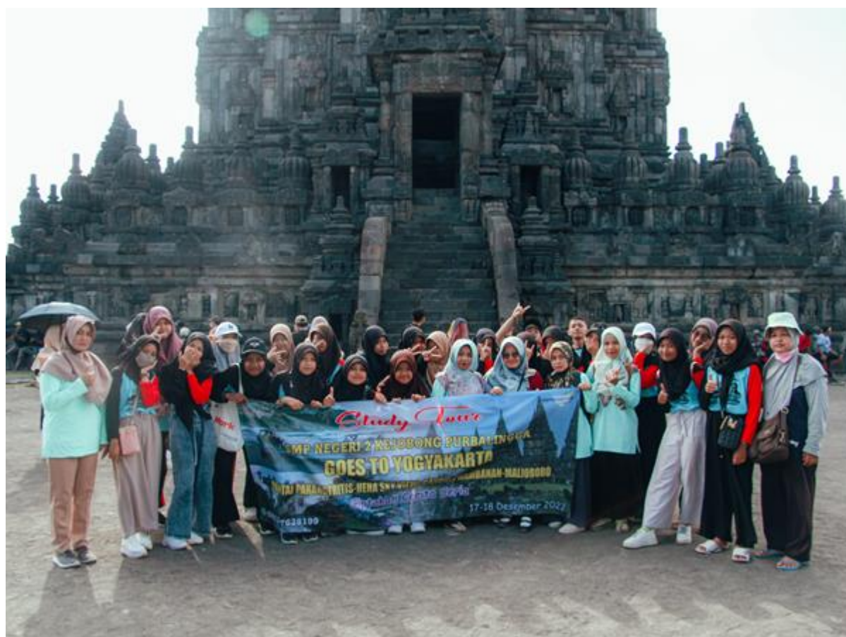
Gambar 1:

Salah satu cara terbaik untuk menggunakan Candi Borobudur sebagai media pembelajaran adalah dengan mengunjungi situs ini secara langsung. Siswa dapat belajar tentang sejarah, arsitektur, dan budaya Indonesia melalui pengalaman langsung. Selain itu, siswa juga dapat belajar tentang nilai-nilai Buddha yang terkandung dalam candi ini.