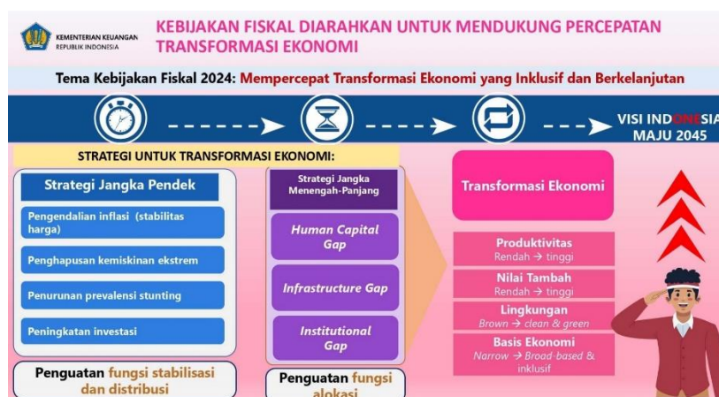
Gambar 1. Tema Kebijakan Fiskal: Mempercepat Transformasi Ekonomi yang Inklusif dan Berkelanjutan

Keadilan fiskal adalah salah satu pilar penting dalam sistem perpajakan yang adil dan berkelanjutan. Keadilan fiskal mencakup aspek-aspek seperti distribusi beban pajak yang adil, peningkatan kesadaran wajib pajak, dan pencegahan penipuan serta penghindaran pajak, karena penting juga untuk memastikan bahwa reformasi pajak tidak hanya berfokus pada peningkatan pendapatan pemerintah, tetapi juga pada keadilan sosial dan ekonomi (Jaelani & Basuki, 2016). Pada akhir periodenya yakni tahun 2024 nanti Presiden Joko Widodo memiliki sekitar Rp 3.304,1 triliun dalam RAPBN 2023 yang memiliki fokus untuk mempercepat transformasi ekonomi inklusif yang berkelanjutan, rancangan tersebut dapat dilihat dalam gambar berikut: