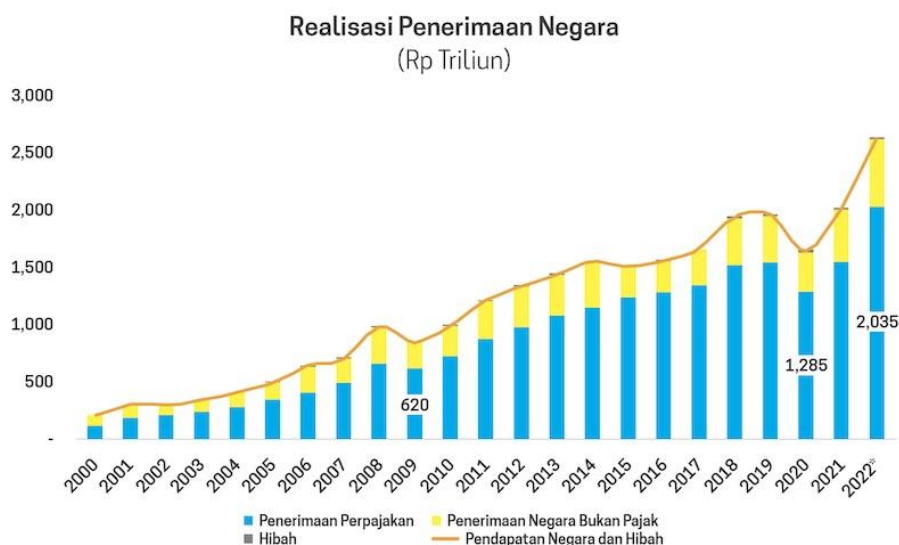
Gambar 3. Realisasi Penerimaan Negara (2000-2022)

Pajak atas Pendapatan Tinggi diatur dalam Pasal 17 Undang-Undang Pajak Penghasilan (UU PPh) yang merupakan salah satu undang-undang pokok yang mengatur perpajakan. Pasal 17 UU PPh mengatur tentang tarif pajak penghasilan bagi wajib pajak pribadi yang memiliki penghasilan bruto atau penghasilan kena pajak dalam jumlah yang lebih tinggi, yang dikenakan tarif pajak progresif. Salah satu cara yang efektif untuk meningkatkan keadilan adalah dengan meningkatkan tarif pajak atas pendapatan tinggi. Hal ini bisa dilakukan dengan dasar hukum Undang-Undang Pajak Penghasilan (UU PPh) di Indonesia karena wajib pajak dengan pendapatan yang lebih tinggi seharusnya membayar pajak yang lebih besar untuk mendukung layanan publik dan redistribusi pendapatan. Data penerimaan pajak dapat dilihat pada gambar berikut: