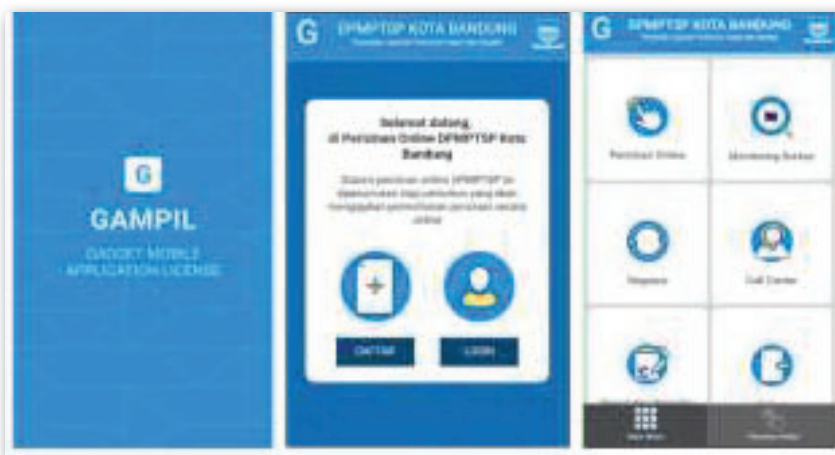
Gambar 1. Aplikasi GAMPIL