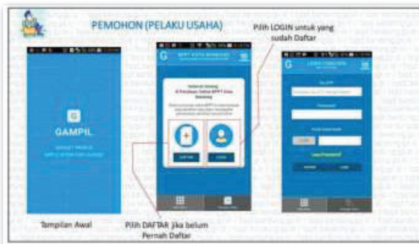
Gambar 2. Tampilan Aplikasi pada Google Playstore